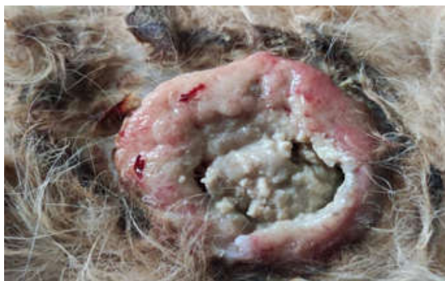
Рисунок 1. Опухоль молочной железы. Изъязвление