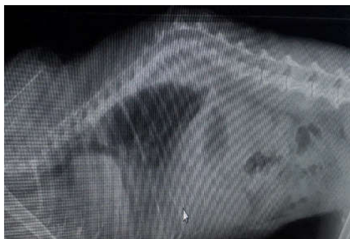
Рисунок 3. Рентгенографический снимок грудной полости. Правая латеральная проекция