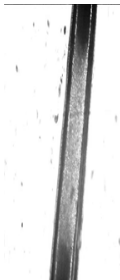
Рисунок 5. Остевой волос волка (аммиак)