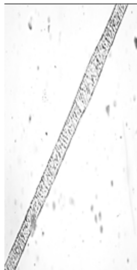
Рисунок 6. Остевой волос корсака