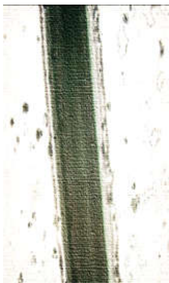
Рисунок 4. Остевой волос волка

У корсаков (рис. 6) сердцевина покровных волос имеет ярко выраженный рисунок в виде сетчатой структуры, иногда в виде поперечно расположенных и вытянутой формы прямоугольников. Сердцевина покровных волос корсаков непрерывна и построена из плотно лежащих клеток.