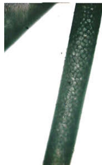
Рисунок 3. Остевой волос изюбря (аммиак)

вполне развитую сердцевину, которая тянется непрерывно практически по всему волосу и состоит из клеток полигональной формы, значительных размеров и расположенные в поперечном направлении.