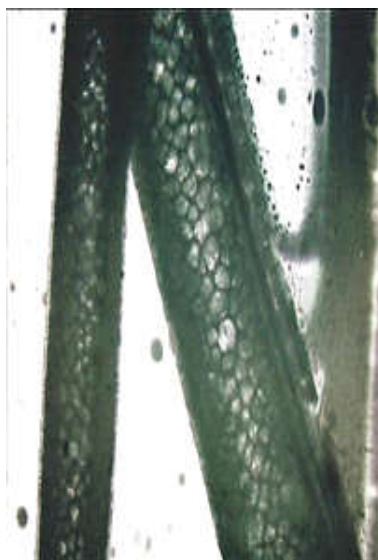
Рисунок 2. Остевой волос изюбря