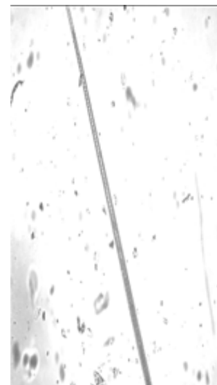
Рисунок 7. Остевой волос домашней кошки

Кошачьи. У различных пород домашних кошек общим в строении сердцевинны