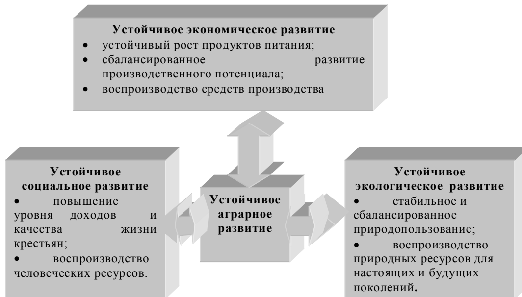
Рисунок 1 – Взаимосвязь составляющих устойчивого развития аграрного сектора экономики

сурсов, повышением благосостояния и качества жизни сельчан, стабильным и сбалансированным природопользованием. Только при сбалансированности экономической, социальной и экологической составляющих обеспечивается устойчивое развитие отрасли в течение длительного времени [2]. Тесная взаимосвязь составляющих устойчивого развития аграрного сектора экономики представлена на рисунке 1.